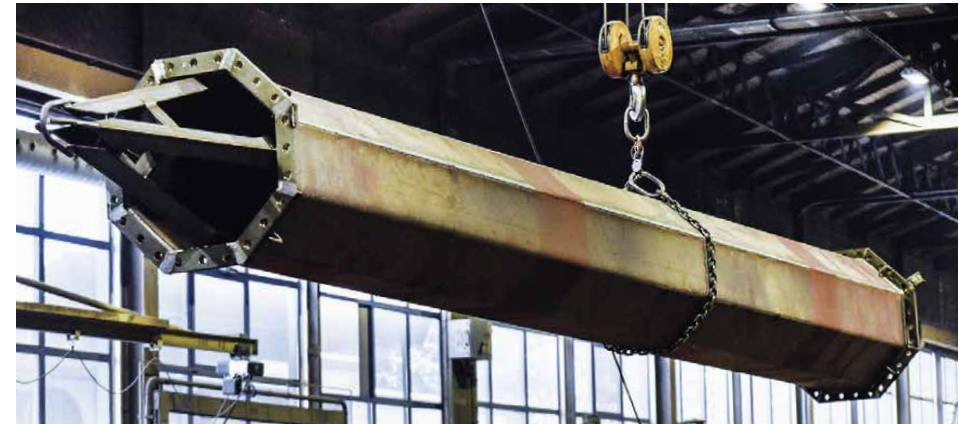
In basso: Un elemento degli otto piloni eseguiti per la «Fête des Vignerons» a Vevey