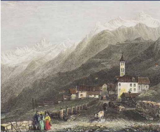
Vista di Airolo prima del 1882